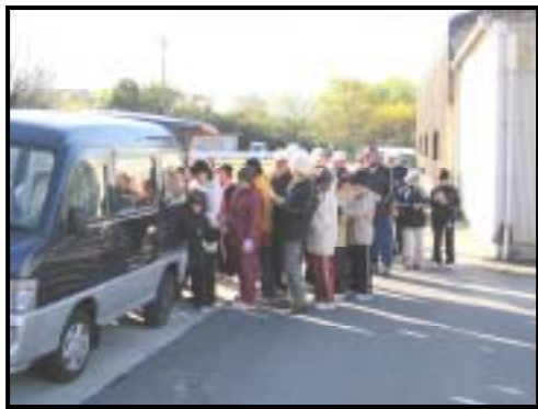
お楽しみポイントめぐり

広報掲載については、2月1日(火)発行予定の「力をあわせて市民協働のまちづくり」のコーナーで紹介されます。