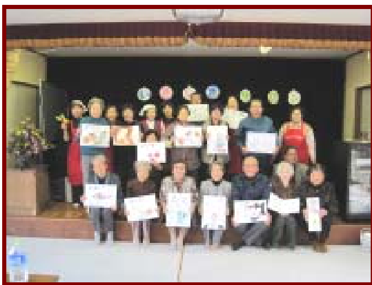
絵手紙に挑戦しました