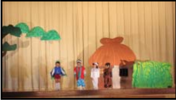
幼稚園 「ももたろけ」