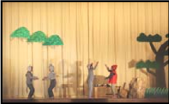
劇 1年生 「おむすび ころりん」