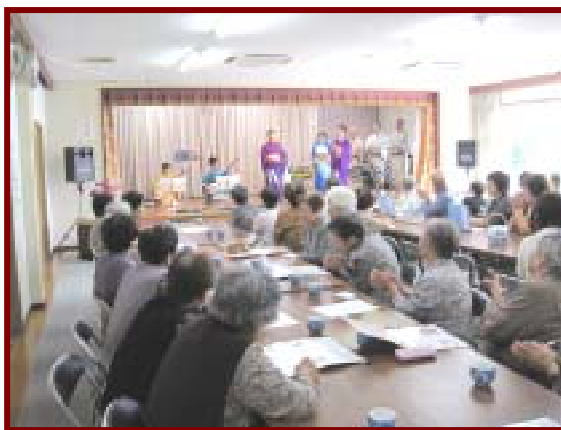
楽しい民謡でした