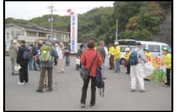
11月13日(土) 向田港集合