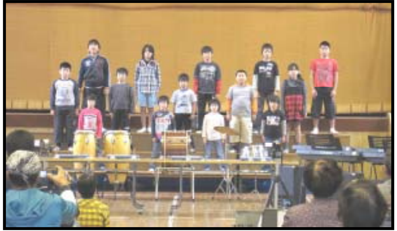
小学校(全) 「音楽・群読」

11月14日(日)、新しく改築した鷺浦小学校体育館で「さぎっ子祭」が行われました。