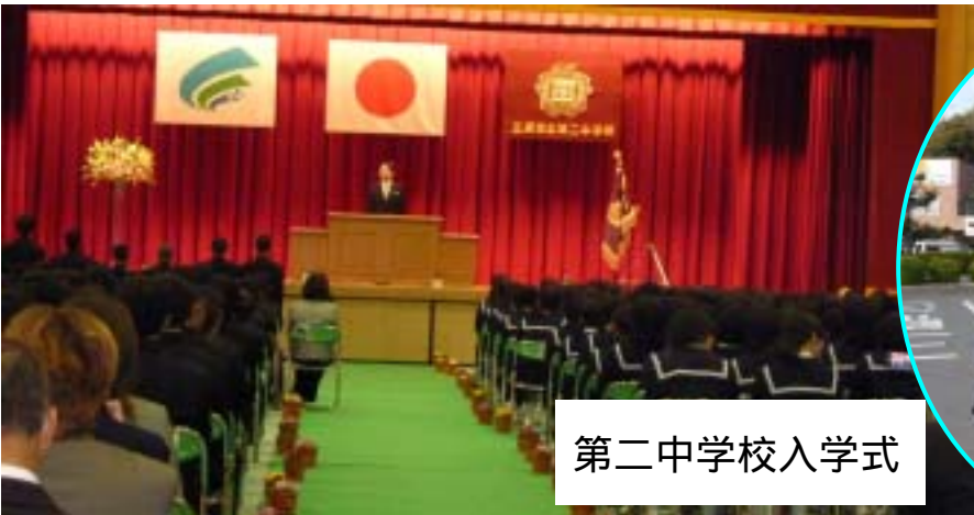
第二中学校入学式